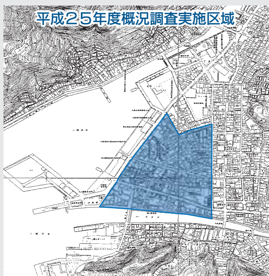
平成25年度概況調査実施区域

市では、都市計画の策定や地震・津波などの災害に備えるために地籍の明確化を進めており、本年12月より、市街地の概況調査(予備調査)を開始します。この調査は、土地の専門家である調査士が現地でご図と現況の違いがあるかどうかを検証するものです。一筆地調査とは違って 土地所有者の境界立会 は行いません。調査士と調査員(市職員)が皆さまの土地内に立ち入ることもありますが、ご理解ご協力をお願いします。