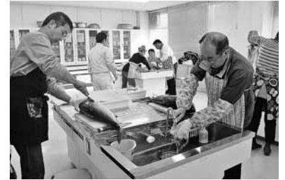
(昨年の教室の様子)