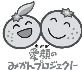
「みかんオブジェ完成イメージ」