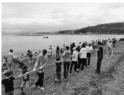
地域で取り組む「地引き網交流会」

に感謝し、力を合わせて網を引くことを誓います」という真穴小中、川上小各代表者三名による選手宣誓の後、地引き網が始まりました。保小中の子どもたちや保護者・地域・来賓の方々がみんなで声を合わせ、しっかりと網を引き、今年度もたくさん魚を捕ることができました。真穴の自然の恵みにみんなで感謝し、豊かな海を守り続けることを誓います。