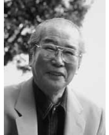
童門 冬二 (作家)