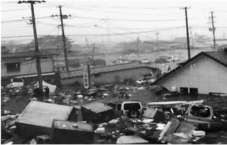
東日本大震災 被災地写真 (宮城県石巻市)