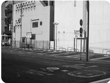
※写真は新町角駐車場