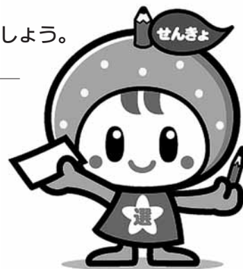
愛媛県選挙管理委員会 選挙啓発キャラクター「アッピー」

8月27日任期満了に伴う八幡浜市議会議員選挙を、次の日程で行います。 未来の八幡浜のための大切な選挙です。有権者の皆さん、必ず投票に行きましょう。