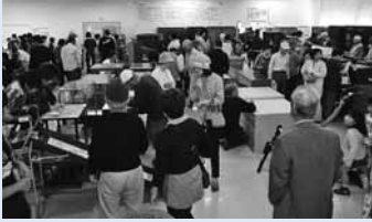
昨年のリサイクルフェアの様様