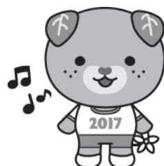
えひめ国体マスコット みぎゃん