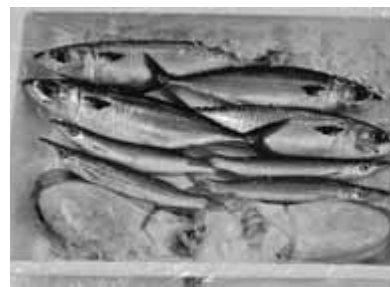
10月のお魚 (受講者2人分)

◆申し込み・問い合わせ 市役所水産港湾課水産係 ☎22-3111 内線407 てもらうために、受講回数が少ない方を優先させていただきます。