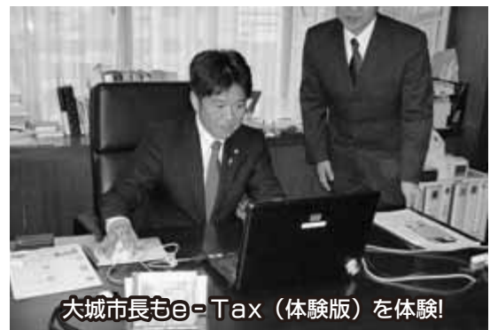
大城市長もe-Tax(体験版)を体験!