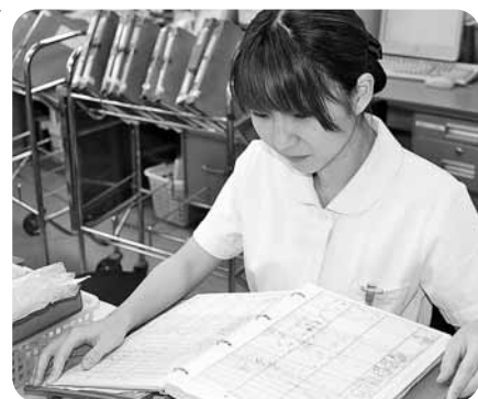
（ダウンロードもできます）