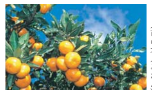
(市の木 / みかん)

発行：八幡浜市役所 発行日：毎月1日 ■八幡浜市ホームページ / http://www.city.yawatahama.ehime.jp 編集：政策推進課広報統計係 ☎22-3111 内線345 ■Eメール / seisaku@city.yawatahama.ehime.jp