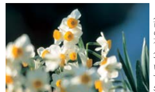
(市の花 / すいせいせん)