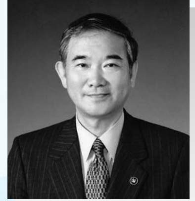
八幡浜市長 高橋 英吾