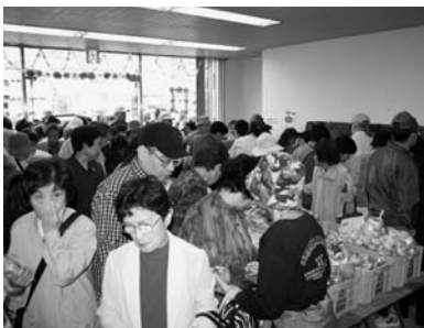
JR八幡浜駅の空き店舗を活用した“駅なか浜っ子産直市”