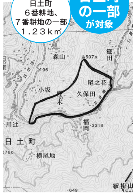
平成20年度 地籍調査実施区域

八幡浜市では、昭和48年度から地籍調査を実施しています。平成20年度は、日土町6番耕地7番耕地の一部の区域を実施します。