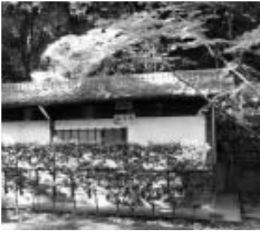
現在の平家谷公園公衆トイレ