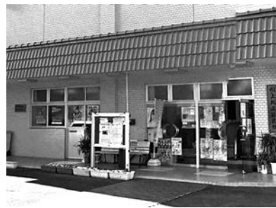
川上出張所で働いてみませんか？

●平成26年度保育所における 日々雇用保育士の登録募集 市では、常勤保育士が休んだ場合に、代わりに保育所で勤務をしていただける方の登