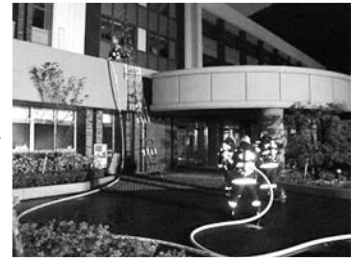
昨年の訓練の様子

日 時 11月2日(日) 午前6時30分～7時30分までの間 場 所 特別養護老人ホーム ことぶき荘 内 容 秋季全国火災予防運動に先駆け、「ことぶき荘」を火点として、消防署・消防団合同による模擬火災訓練を実施します。 ※訓練に伴いまして、早朝よりサイレンを吹鳴しますが、ご理解のほどよろしくをお願いします。