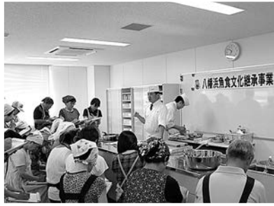
誰でも参加できる 楽しい料理教室です