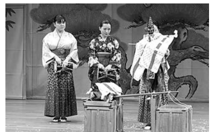
阿波木偶箱まわし保存会 徳島市国府町