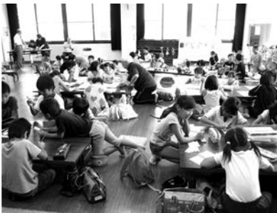
地域ぐるみの体験活動を通して生き生きと活動する子どもたち