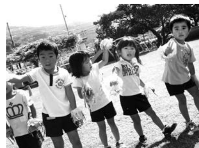
あなたの登録をお待ちしています