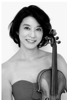
高嶋 ちさ子 (ヴァイオリン)