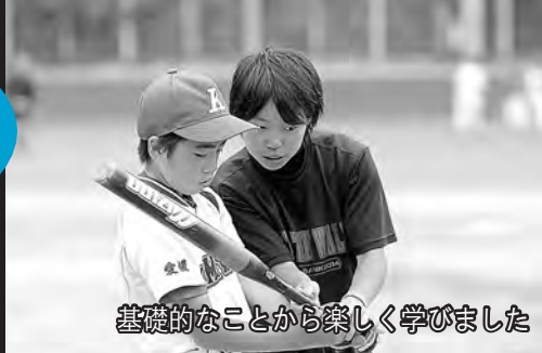
基礎的なことから楽しく学びました