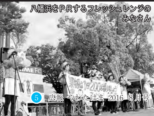
八幡浜をPRするフレッシュレンジのみなさん