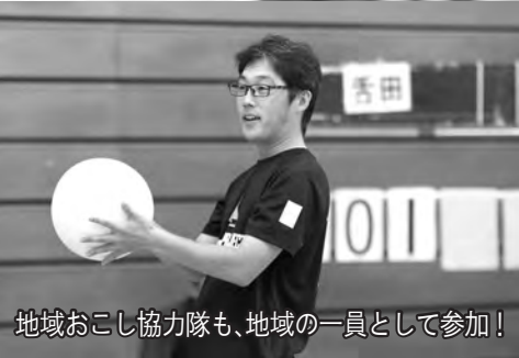
地域おこし協力隊も、地域の一員として参加!