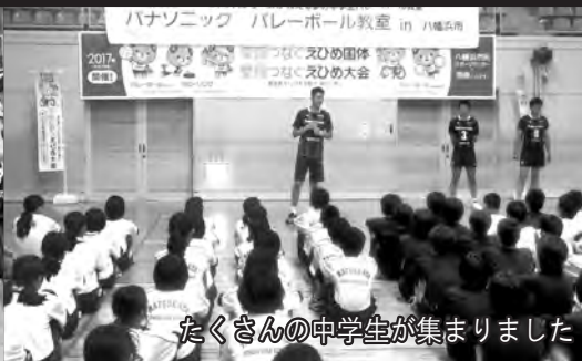
たくさんの中学生が集まりました