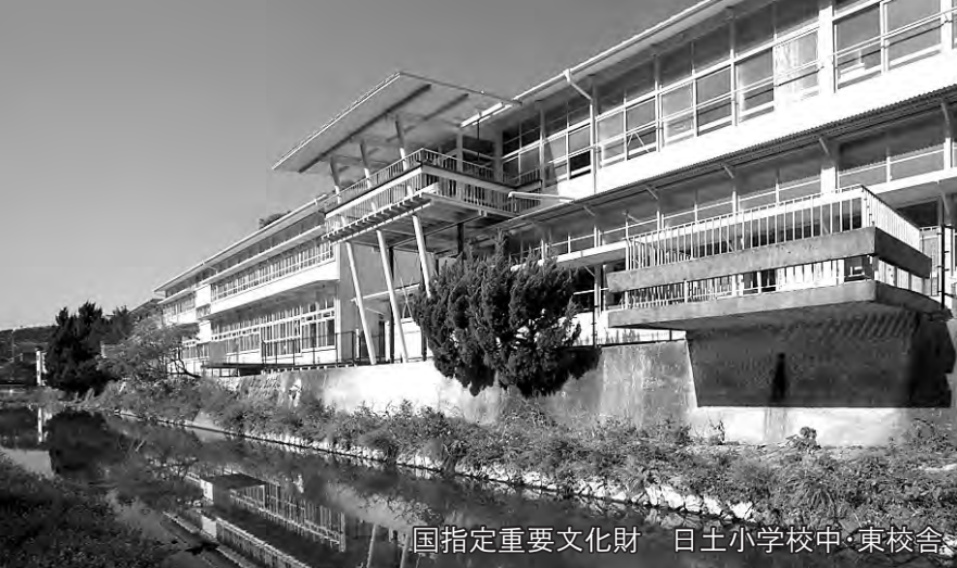
国指定重要文化財 日土小学校中・東校舎