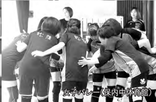
女子バレー(保内中体育館)