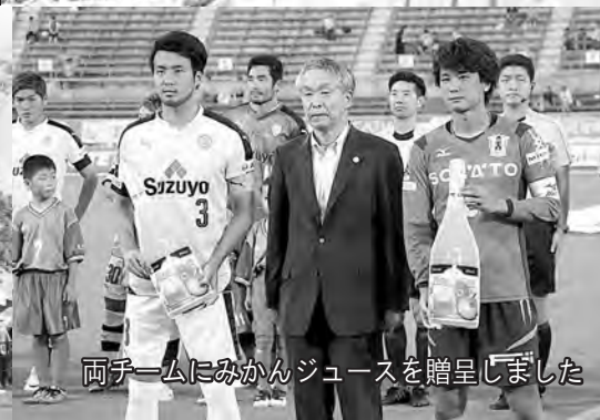
両チームにみかんジュースを贈呈しました