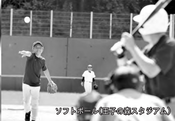
ソフトボール(王子の森スタジアム)