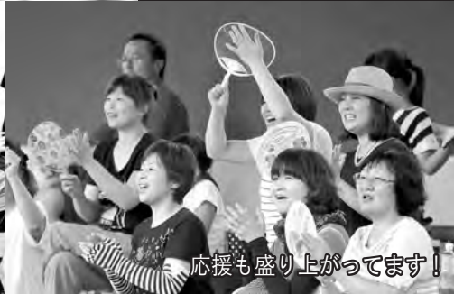
応援も盛り上がっています!