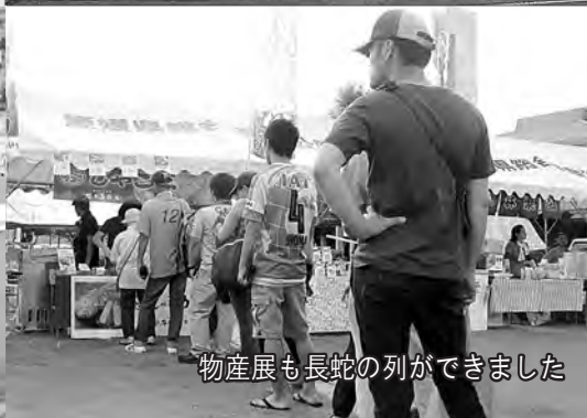
物産展も長蛇の列ができました