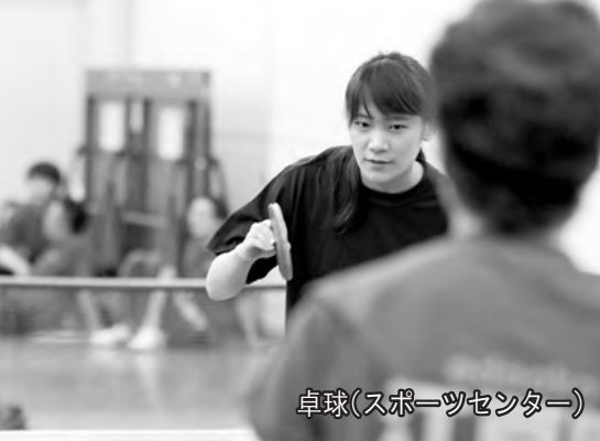
卓球(スポーツセンター)