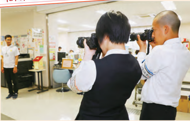
八幡浜高校の3年生2名が、職場体験として市役所にやってきました。八幡浜市の広報担当として活動した仕事内容の様子をレポートします！