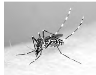
ヒトスジシマカ

蚊媒介感染症は、ウイルスを保 有するヒトスジシマカ等の媒介 蚊に刺されることで発症し、デン グ熱やジカウイルス感染症等が 該当します。