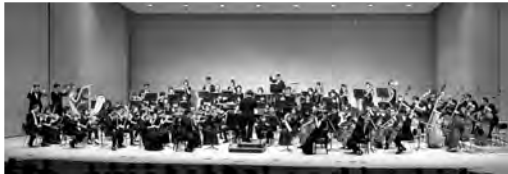
四国フィルハーモニー管弦楽団