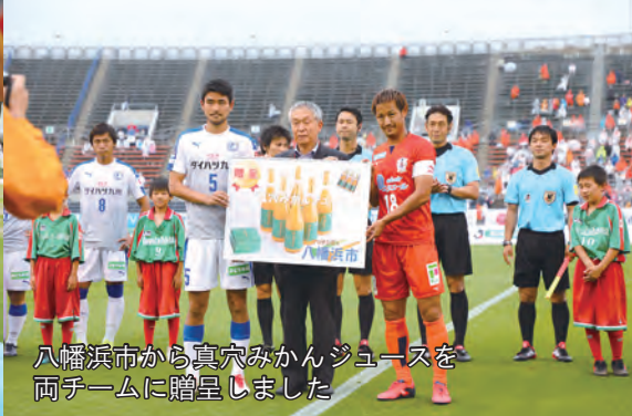
八幡浜市から真穴みかんジュースを両チームに贈呈しました