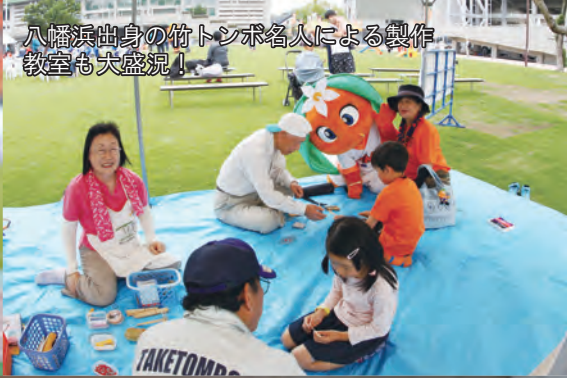
八幡浜出身の竹トシボ名人による製作教室も大盛況！