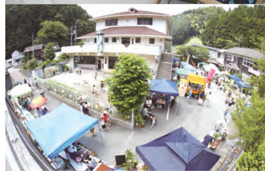
旧日土東に賑やかな空間が生まれました