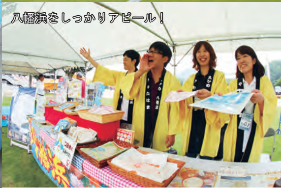
八幡浜をしっかりとアピール！