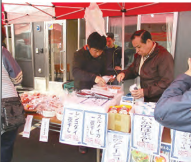
▲ みかんの花マルシェで加工品を販売