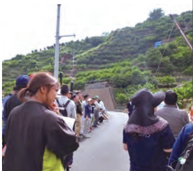
▲ 柑橘栽培について受講中

八幡浜にもフットサルのリーグができるという噂を聞いて、自分でもチームを作りたいと思っています。興味のある方、一緒にやりませんか!?