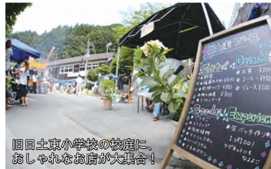
旧日土東小学校の校庭に、おしゃれなお店が大集合！