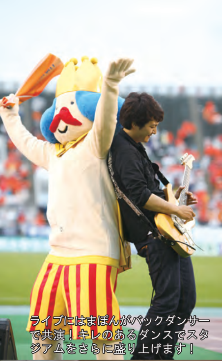
ライブにはまぼんがバックダンサーで共演！キレイのあるダンスでスタジアムをさらに盛り上げます！