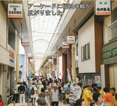
アーケードに福祉の輪が広がりました