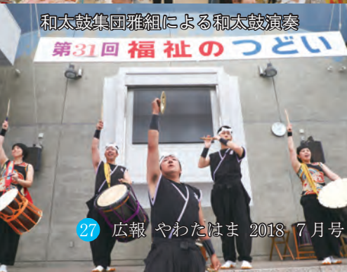
和太鼓集団雅組による和太鼓演奏 第31回福祉のつどい