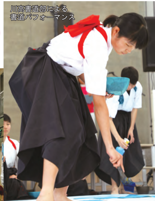
川高書道部による書道パフォーマンス