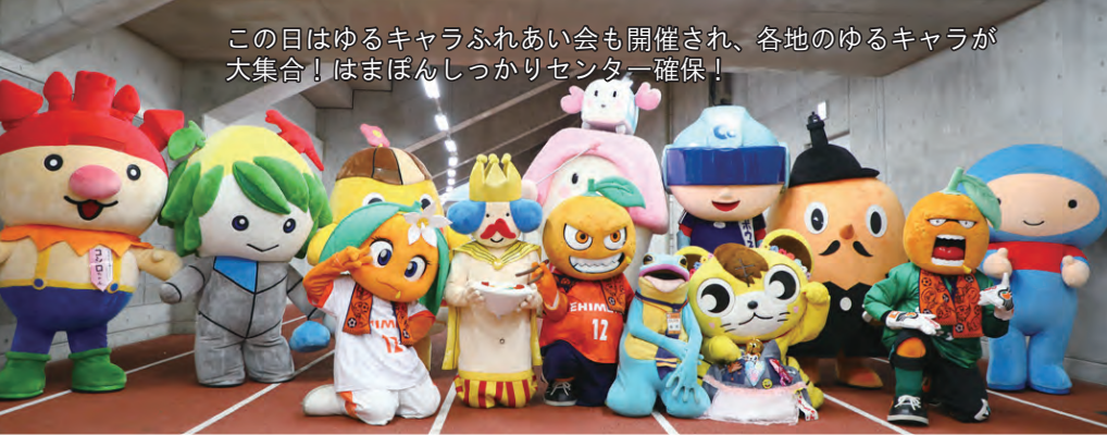
この日はゆるキャラふれあい会も開催され、各地のゆるキャラが大集合！はまぼんしっかりセンター確保！