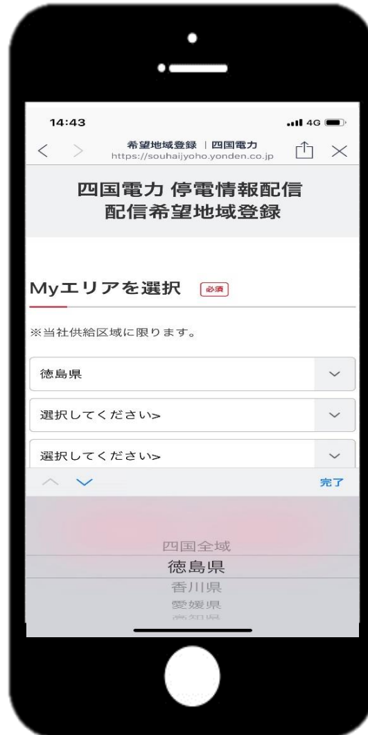
②四国全域または県を選択