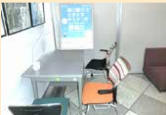
愛結びコーナーの様子