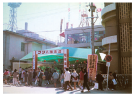
写真5-23 フジ八幡浜店オープン

当日は長蛇の列が続き、その後も盛況を極めた。開店イベントでは、八幡浜の名物を盛り込んだ「角力甚句」が高砂部屋と呼出によって披露された。また関脇貴の花、小結高見山のサイン会が行われた。店内に流れるフジの歌「ハッピーショッピングフジ」は、昭和五一（一九七六）年に誕生している。