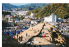
写真2-5 元城跡(発掘調査時) 1999(平成11)年

瀬戸内海と宇和海を結ぶ街道の中間部という特徴をもった小城が、元龜三(一五七二)年に、豊後の大友軍との合戦の舞台となった。城主は得能彦右衛門尉。出海や磯崎の伊予灘側の武士団が防衛に参加したとある。それ以前には城主、兵頭越前守の永祿二(一五五九)年七月一〇日没と記された過去帳(高德寺過去帳)が残る。