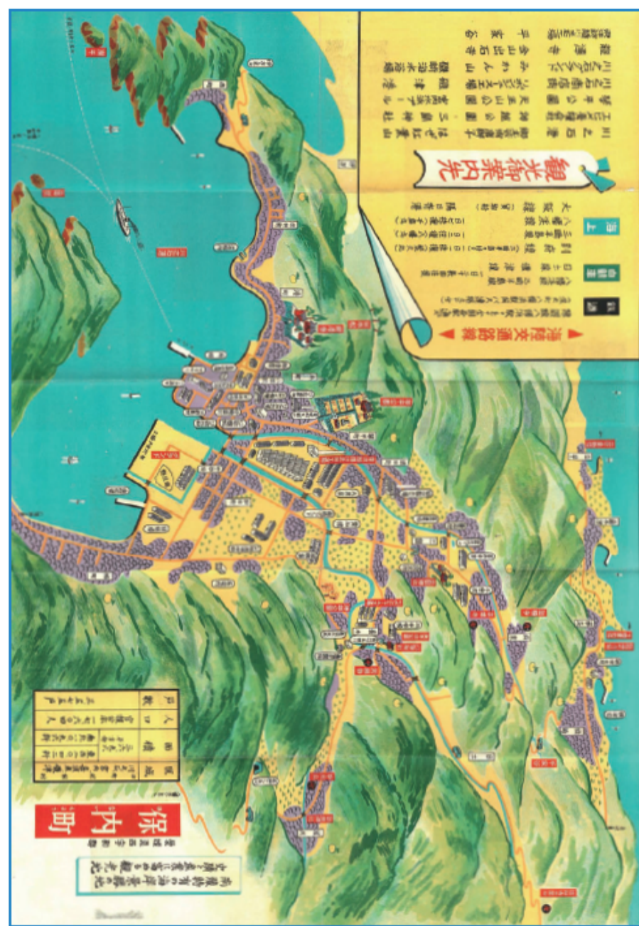
写真5-25 伊勢湾の観光 新興保内へ

当日は長蛇の列が続き、その後も盛況を極めた。開店イベントでは、八幡浜の名物を盛り込んだ「角力甚句」が高砂部屋と呼出によって披露された。また関脇貴の花、小結高見山のサイン会が行われた。店内に流れるフジの歌「ハッピーショッピングフジ」は、昭和五一（一九七六）年に誕生している。