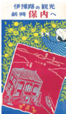
写真5-24 保内町の観光案内

保内町より「伊豫路の観光 新興保内へ」と題した観光案内パンフレットが昭和三〇（一九五五）年〜同三五（一九六〇）年の間に発行されている。パンフレットを開くと表面（写真5・25）には、観光案内先が絵地図で紹介されており、裏面にはその各案内先の解説がある。裏面には、ほかに町勢の概要、産業の様子、交通案内などが次のように紹介されている。