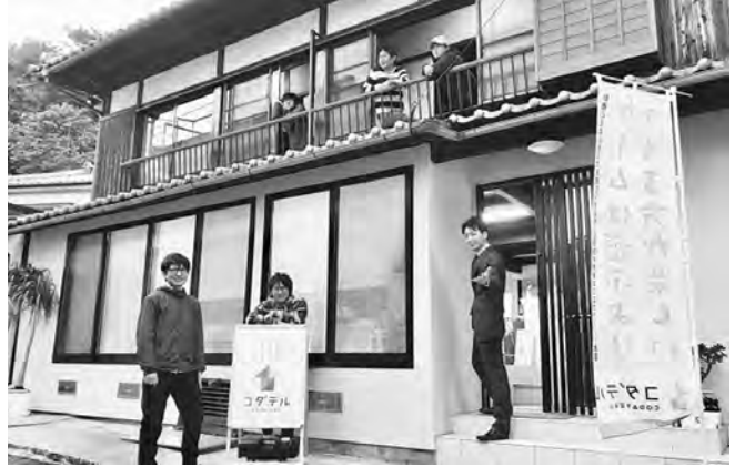
平成29年度に当事業を活用した施設「コダテル」

■申し込み・問い合わせ 建設課 空き家対策係(保内庁舎1階) ☎22-3111 内線2219