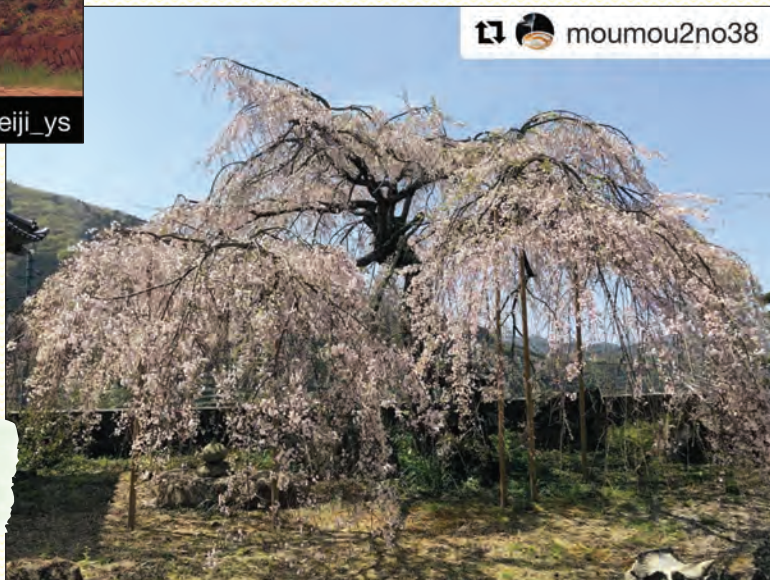
#八ちゃんねる #川舞 #枝垂れ桜

先月号の桜特集をご覧いただきありがとうございました。その後も「まだまだオススメの桜スポット知ってるよ!」と投稿が増え、タイムラインが春の香りでいっぱいになったのでご紹介！