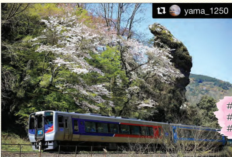
#八ちゃんねる #双岩 #夫婦岩