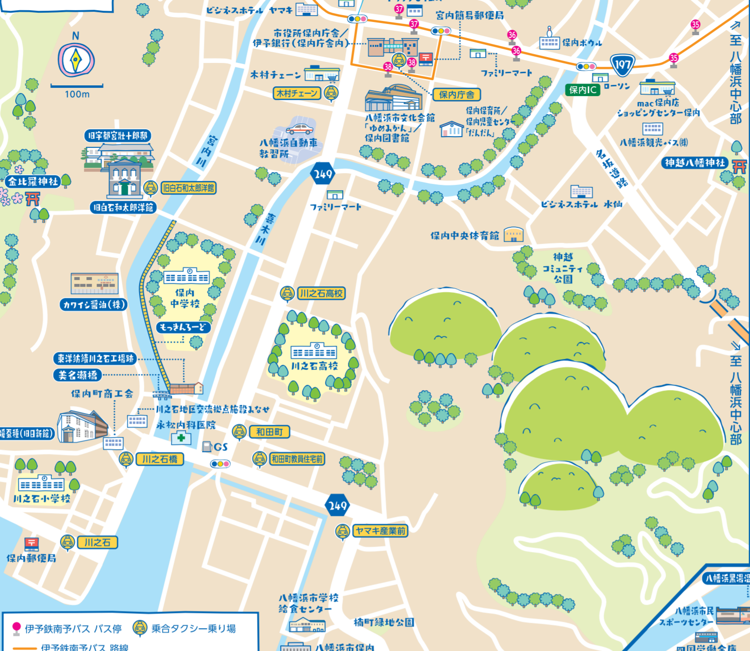
● 伊予鉄南予バス 乗合タクシー乗り場 ● 伊予鉄南予バス 路線